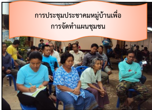
การประชุมประชาคมหมู่บ้านเพื่อ การจัดทำแผนชุมชน