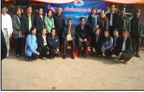
โครงการอำเภอเคลื่อนที่ หน่วยบำบัดทุกข์บำรุงสุข สร้างรอยยิ้มให้ประชาชน