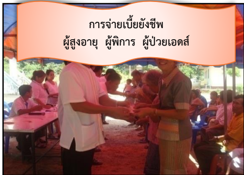
การจ่ายเบี้ยยังชีพ ผู้สูงอายุ ผู้พิการ ผู้ป่วยเอดส์