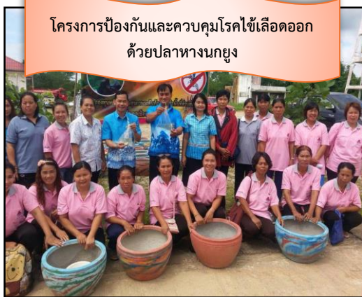
โครงการป้องกันและควบคุมโรคไข้เลือดออก ด้วยปลาหางนกยูง