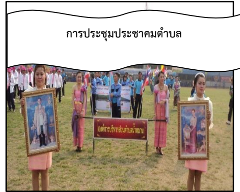
การประชุมประชาคมตำบล