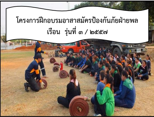
โครงการฝึกอบรมอาสาสมัครป้องกันภัยฝ่ายพล เรือน รุ่นที่ ๓ / ๒๕๕๗