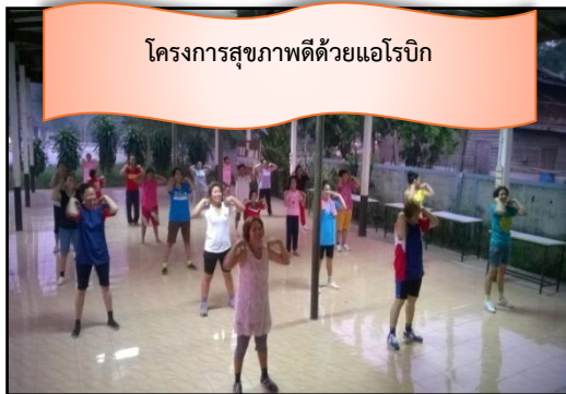
โครงการสุขภาพดีด้วยแอโรบิก