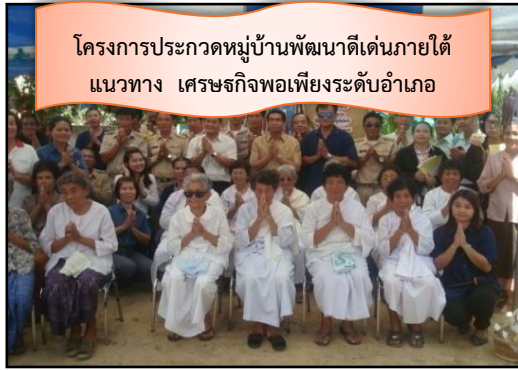
โครงการประกวดหมู่บ้านพัฒนาดีเด่นภายใต้ แนวทาง เศรษฐกิจพอเพียงระดับอำเภอ