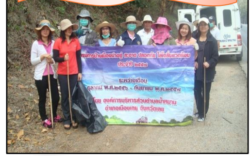
โครงการบ้านเมืองน่าอยู่ สะอาด ปลอดภัย ใส่ใจสิ่งแวดล้อม