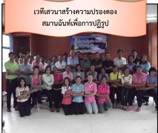
เวทีเสวนาสรางความปรองดอง สมานฉันท์เพื่อการปฏิรูป