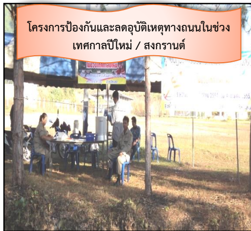
โครงการป้องกันและลดอุบัติเหตุทางถนนในช่วง เทศกาลปีใหม่ / สงกรานต์